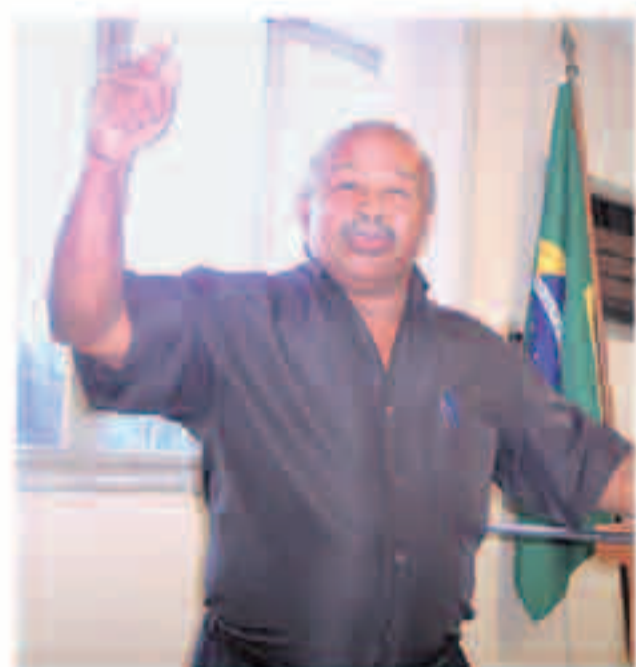
O companheiro Buda lidera nossas lutas, inclusive contra a dupla-função.

Essas lutas, companheiros, não acabam, não terminam senão com a conquista das reivindicações. Estejam certos de que o Sindi-